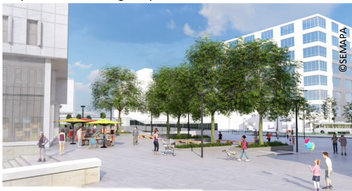
La nouvelle place entre l'avenue de France et Station F

Le périmètre des travaux comprend une partie de l'avenue de France, incluant le terre-plein central, ainsi qu'une nouvelle place prolongée par un grand escalier, permettant de relier l'avenue de France au parvis Alan Turing, au pied de Station F.